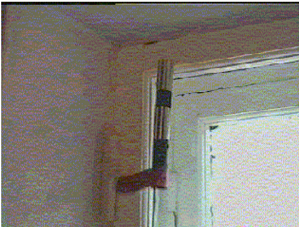
Пример установки антенны как комнатной