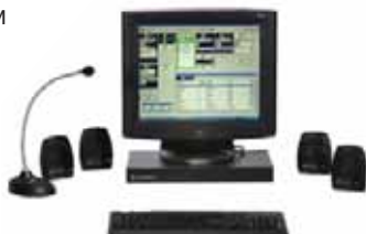
Диспетчерский пульт MCC7500

При помощи виртуальных ведомственных сетей организации могут осуществлять коллективное пользование ресурсами сети с необходимым им уровнем безопасности и управления, и при этом не тратить средств на создание отдельных инфраструктур. Коллективное пользование сетями позволяет организациям