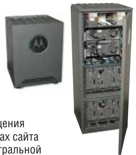
Базовые станции MTS 2 и MTS 4 стандарта TETRA

- Базовые станции Dimetra обладают интеллектуальными возможностями локального тринкинга, позволяющими сохранять возможность общения между абонентами в пределах сайта в случае потери связи с центральной инфраструктурой. Кроме того, базовые станции поддерживают резервирование приемопередающей аппаратуры базовых станций и контроллеров сайтов. Чувствительность приемников базовых станций Motorola нового поколения как минимум на 7 дБ лучше, чем у обычных базовых станций стандарта TETRA. Поэтому с их помощью можно добиться значительного расширения зоны действия сетей без ущерба качеству обслуживания.