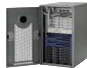
Scalable Dimetra IP

Программные средства Scalable Dimetra IP, которые мы используем в поставляемых нами системах, стабильно обеспечивают очень быстрое установление группового вызова даже между абонентами, находящимися в различных зонах.